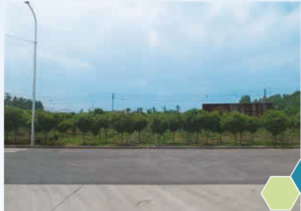
工地裡也盡可能提供種植作為抵消工廠產生的二氧化碳的措施

為了提升節能效益，本集團實施了「產量計酬+節能獎勵」工資核算制，將員工工資收入與企業經濟效益掛起鉤，提高全員細化管理的積極性，實現「我節約我受益」，本ESG報告已詳述細化「能源管理」的具體實施辦法。也隨著生產技術條件的變化，節能目標會定期作出調整。本集團希望透過其機制提升員工們對環境及天然資源使用的認識，對環保作出貢獻。