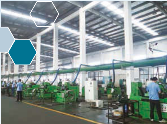
生產車間大大使用天然光

集團運營主要資源使用來自於用水及燒天然氣。用水方面也採取了多項循環再用的措施，減少用水量。在節能方面，生產車間的設計盡量採用天然光，減少燈具的耗電量。