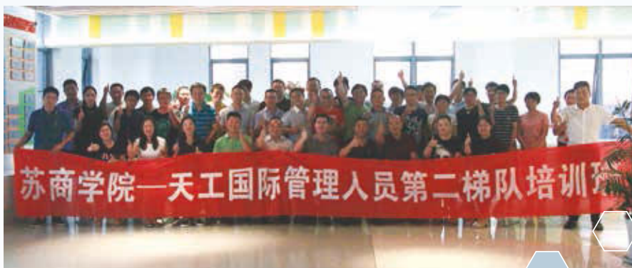
天工國際梯隊人才培訓

今年年度舉行了本集團第二梯隊人才建設培訓計劃，共有39名受訓人員得惠。內容涵蓋「團隊領導培養」、「網商模式創新」、「領導和管理層情商培養」、「企業信息化在業務中的應用」、「企業文化與核心價值觀塑造」等經基礎程。第二梯隊人才培養將成為完成發展重任的重要。按照計劃，本集團將按年度分批次、分階段對工作優秀、忠誠度高的員工繼續進行培訓，持續打造集團未來發展的優秀團隊，為本公司未來發展構建多層次梯隊人才。