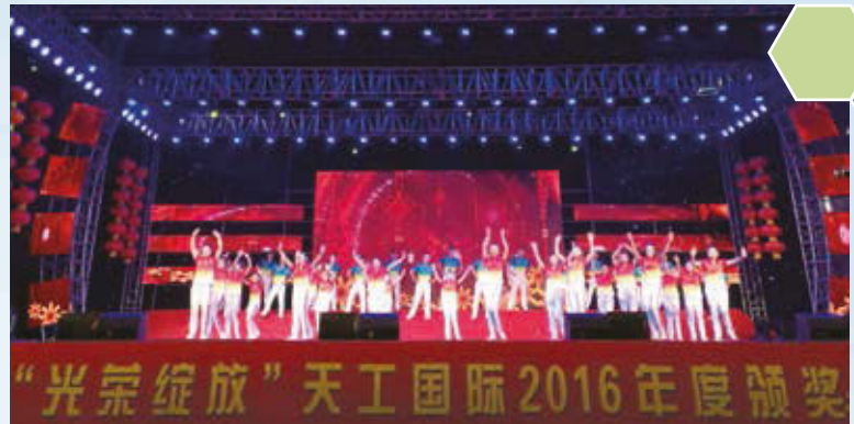
2016年度天工國際頒獎典禮

每年本集團會為員工舉辦頒獎典禮。除此答謝員工們的貢獻同時也提供員工們一個展現才藝的機會，增添氣氛、聯結上下一心。